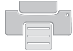
Impression et enregistrement des rapports